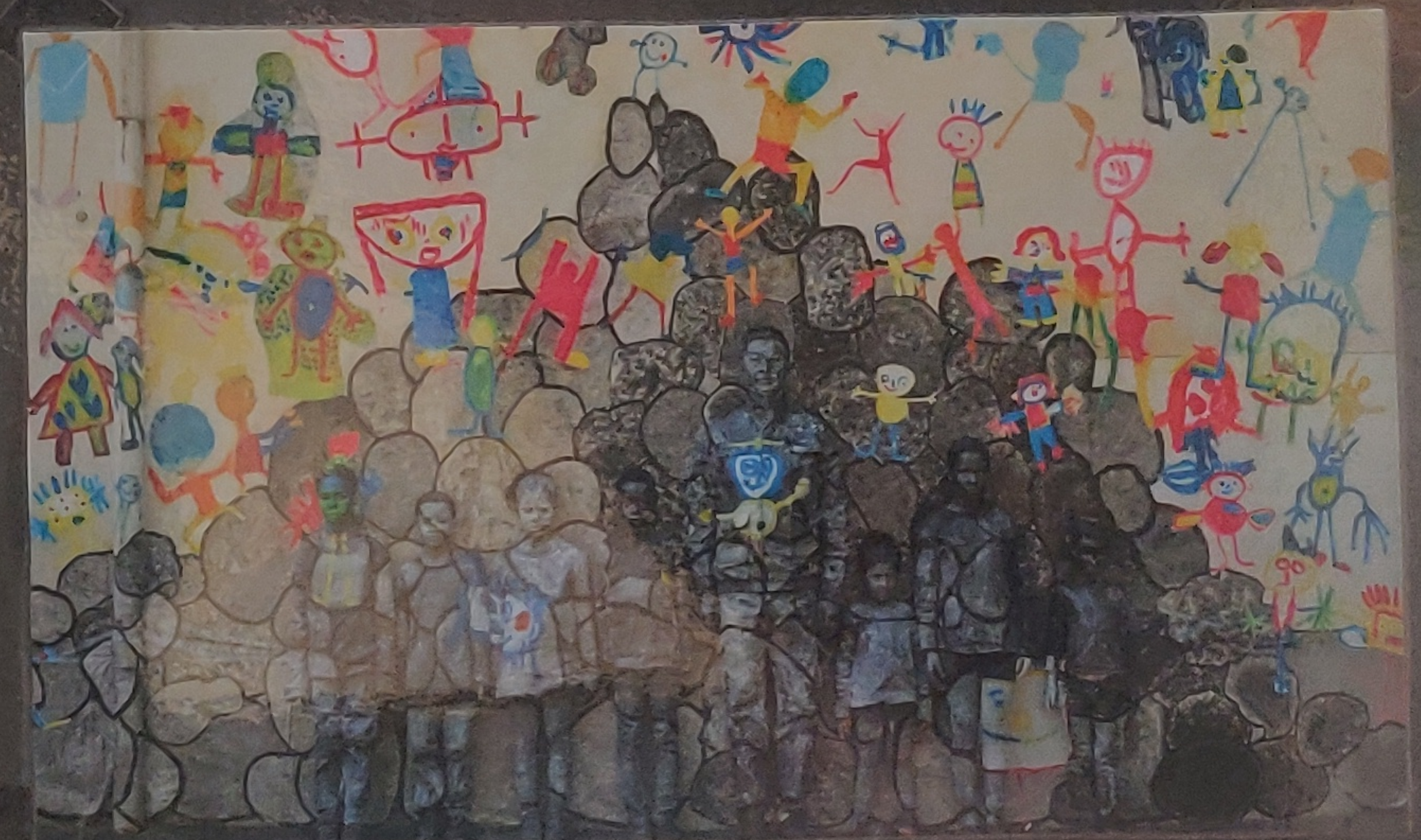
LIU BOLIN DANS UNE ECOLE DE SAINT ETIENNE